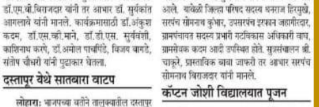
दस्तापूर येथे सातवारा वाटप