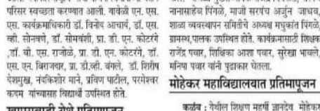
खामसवाडी येथे प्रतिमापूजन