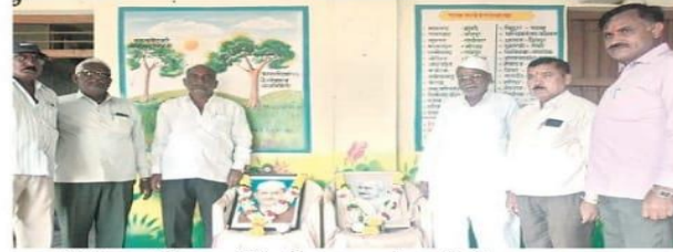
तामनवादी येथील सरस्वती विद्यालयात प्रतिमेस अभिवादन करताना संस्था पदाधिकारी व अन्य मान्यवर.