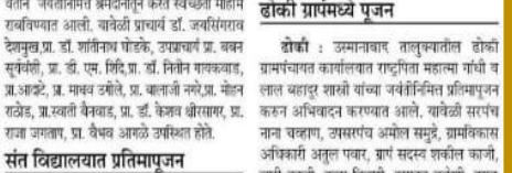
नवोदय विद्यालयात स्वच्छता मोहीम