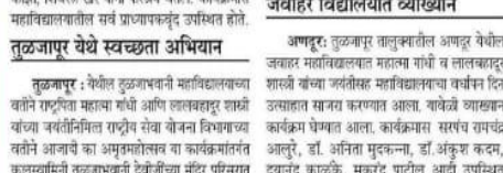
तुळजापूर येथे स्वच्छता अभियान