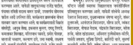
के.टी. पाटील महाविद्यालय