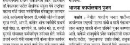
भाजपा कार्यालयात पूजन