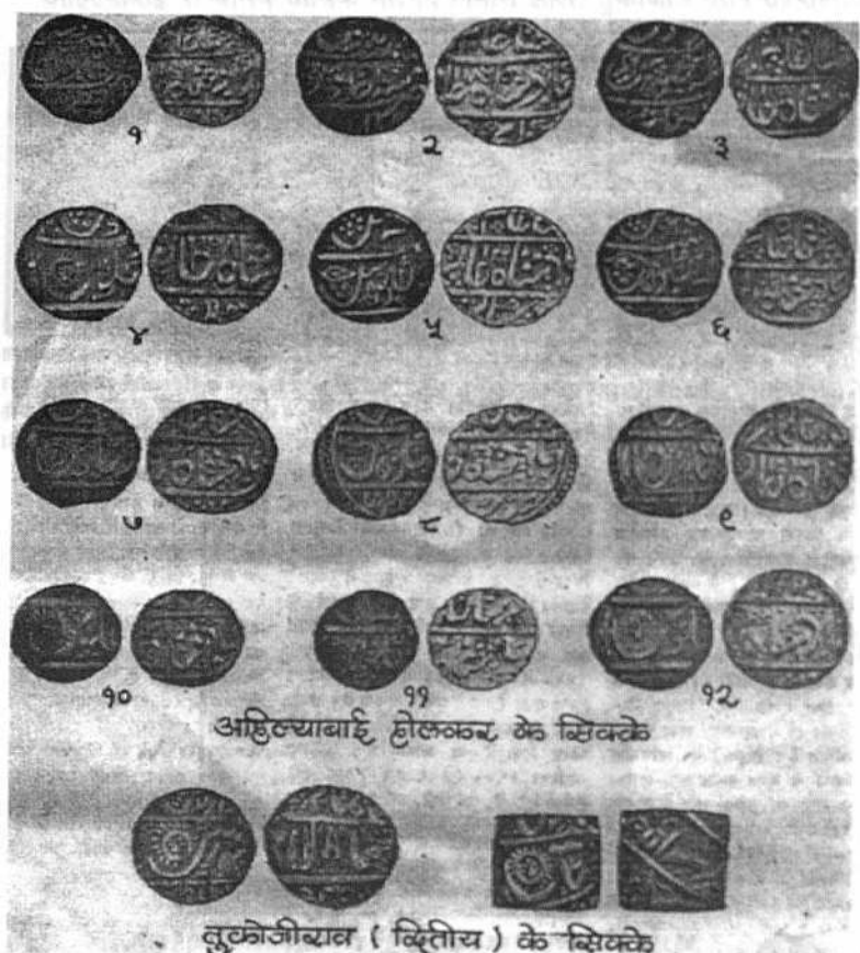
अहिल्याबाई होळकर के सिक्के

सालातील त्यांची ही कूटनीतीची बात अंगकडल्याच्या अहिल्याबाई आणि कूटनीती जालक होत्या परंतु पेशव्यांच्या या निर्देशामुळे लुकोची अहिल्याबाई यांच्याकडे अधिक महत्त्व मिळाले लुकोचीच आणि राध्याबाई