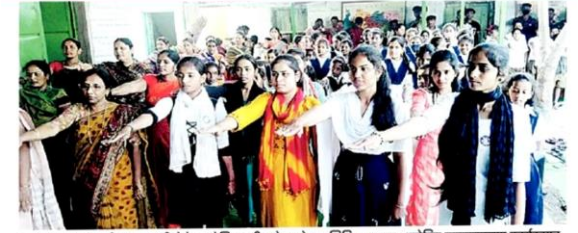
तुळजापूर तालुक्यातील फुलवाडी येथे आयोजित राष्ट्रीय सेवा योजना शिबिरादरम्यान आयोजित व्याख्यानच्या कार्यक्रमाला उपस्थितांकडून बालविवाह प्रतिबंधाबाबत सामूहिक प्रतिज्ञा घेण्यात आली.

Hello Osmanabad Page No. 4 Jan 24, 2023 Powered by: erelego.com