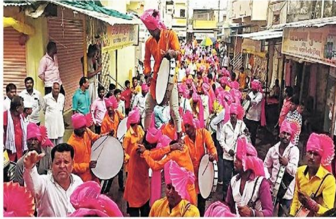
अणदूर येथे रविवारी आयोजित हलगी महोत्सवानिमित्त काढण्यात आलेल्या शोभायात्रेत सहभागी समाजबांधव.

सादरीकरण केले. हुतात्मा स्मारक मंदिर परिसरात शोभायात्रेची सांगता करण्यात आली. यानंतर आयोजित हलगी महोत्सव सोहळ्याच्या अध्यक्षस्थानी माजी मंत्री