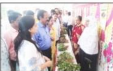
यावेळी विद्यार्थ्यांनी तयार केलेल्या रानभाजीचे स्वादूंचे प्रदर्शन केले. यावेळी विद्यार्थ्यांनी तयार केलेल्या रानभाजीचे स्वादूंचे प्रदर्शन केले.

यावेळी विद्यार्थ्यांनी तयार केलेल्या रानभाजीचे स्वादूंचे प्रदर्शन केले. यावेळी विद्यार्थ्यांनी तयार केलेल्या रानभाजीचे स्वादूंचे प्रदर्शन केले. यावेळी विद्यार्थ्यांनी तयार केलेल्या रानभाजीचे स्वादूंचे प्रदर्शन केले.