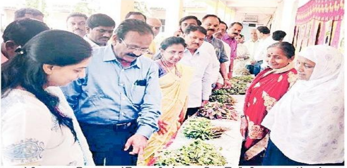
अणदूर येथील जवाहर महाविद्यालयात आयोजित रानभाजी महोत्सवात दुर्मिळ आणि औषधी अशा रानभाज्यांचे प्रदर्शन भरविण्यात आले होते.

Hello Osmanabad Page No. 3 Oct 20, 2022 Powered by: erelego.com