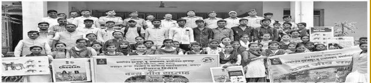
अणदूर : जवाहर महाविद्यालयात वन्यजीव सप्ताहाचे आयोजन करण्यात आले या प्रसंगी वन्यजीवप्रेमी व विद्यार्थी.