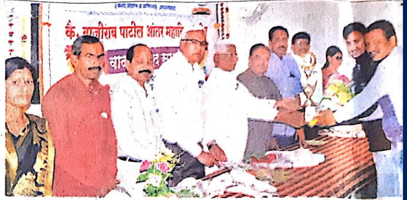
वादविवाद स्पर्धेतील विजेत्या विद्यार्थ्यांना तेरणा महाविद्यालयात मान्यवरांच्या हस्ते पारितोषिक देण्यात आले.